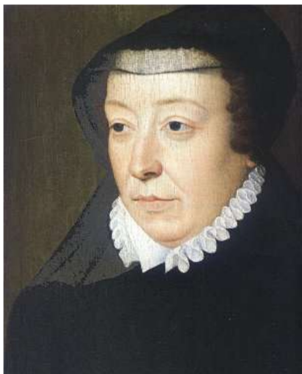
Catherine de Médicis vers 1565