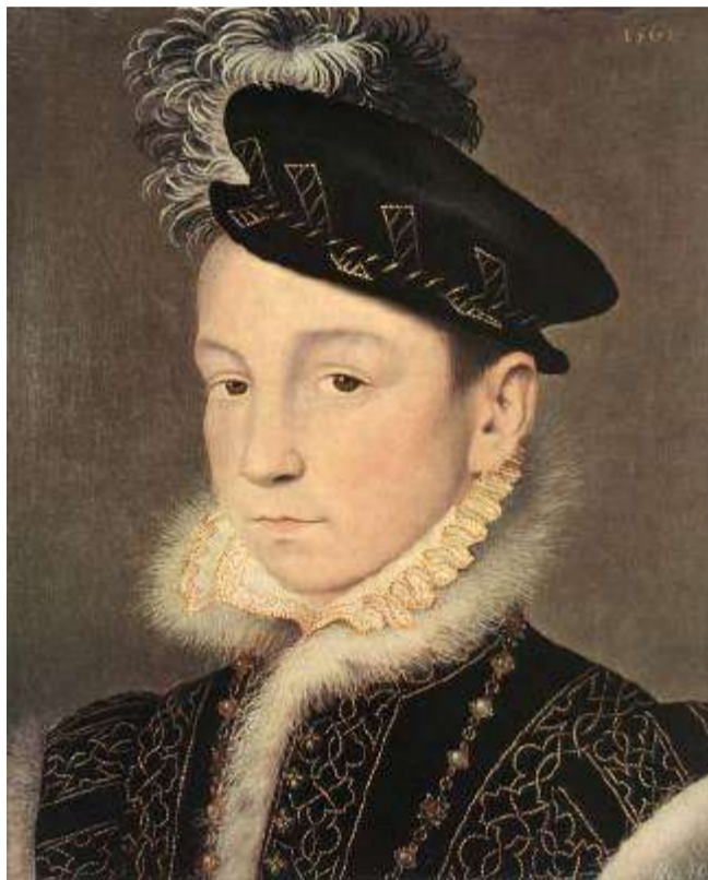
Charles IX à 11 ans Portrait par François Clouet (1561)

RECUEIL & discours du voyage du roy Charles IX de ce nom, à présent régnant ; accompagné des choses dignes de mémoire faites en chacun endroit, faisant sondit voyage en ses pays & provinces de Champagne, Bourgoigne, Daulphiné, Provence, Languedoc, Gascoigne, Bayonne & plusieurs autres lieux, suivant son retour depuis son partement de Paris jusques à son retour audit lieu, ès années mil cinq cent soixante quatre & soixante & cinq.