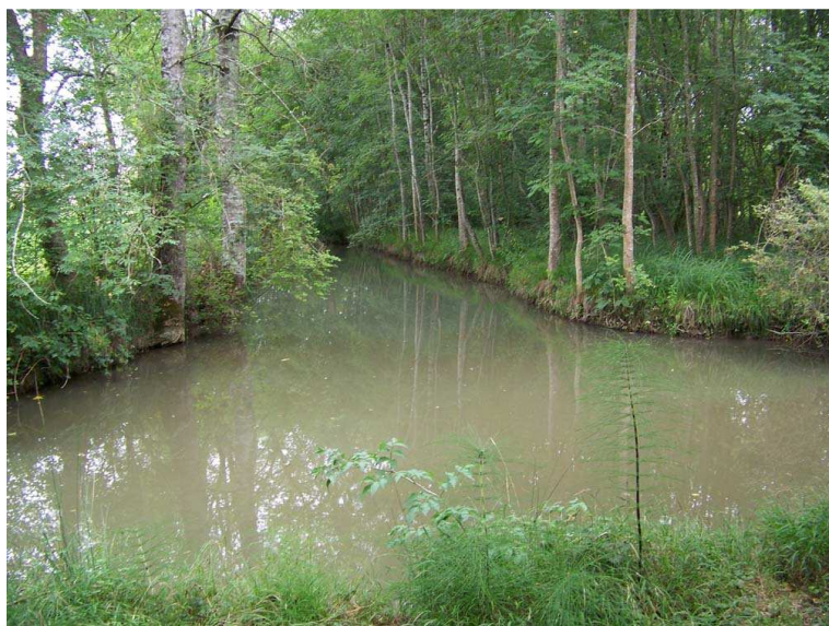
Confluent de la Belle et de la Nizonne

Les deux photos de droite montrent un radeau dérivant immobilisé au confluent de la Belle et de la Nizonne.