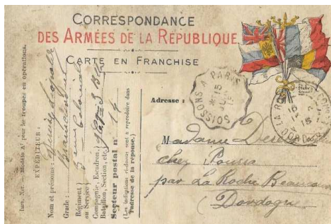
Une carte de Léopold Dereix