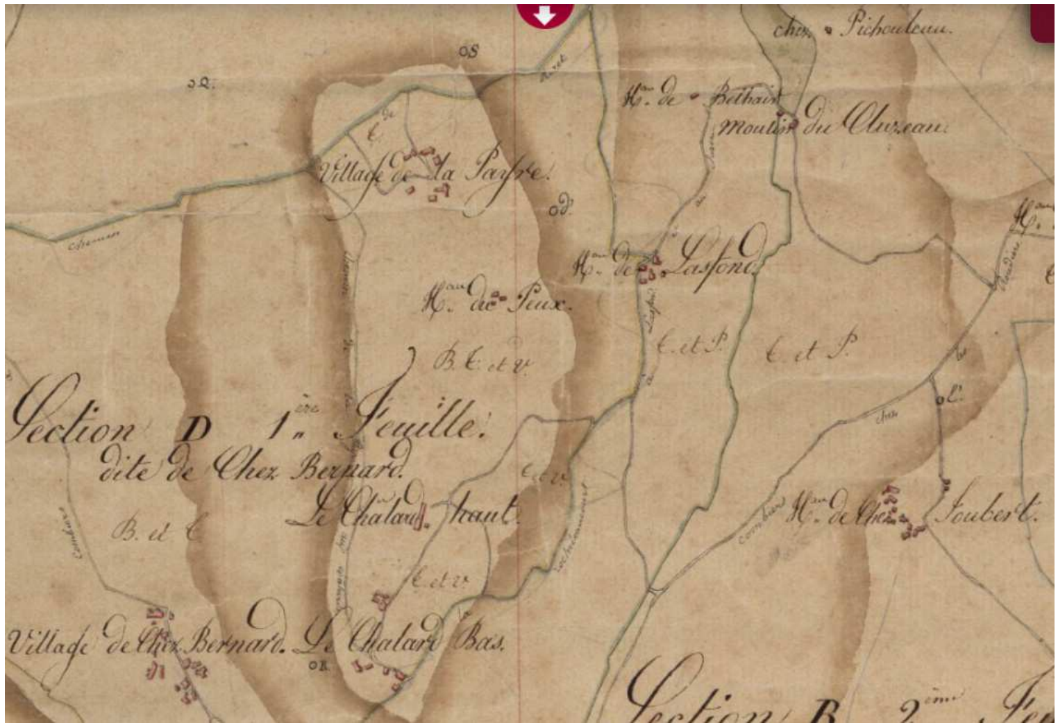
Extrait du cadastre dit Napoléonien de 1826