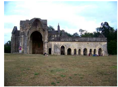
(9) Abbaye Cistercienne de Boschaud N 45° 25' 21.32", E 0° 43' 56.18"