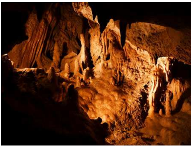
(7) Grotte de Villars N 45° 26' 32.34", E 0° 47' 6.33"