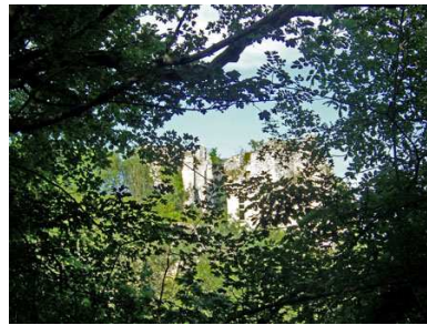
(5) Château de Bruzac (ruines) N 45° 22' 55.6", E 0° 48' 08.3"