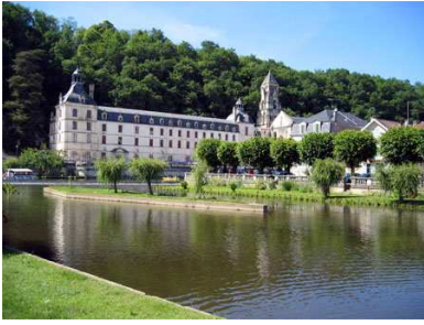
(1) Brantôme N 45° 21' 45.9", E 0° 38' 55.2"