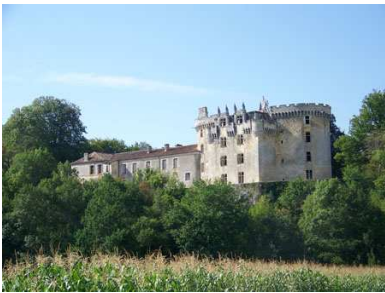
(4) Château La Chapelle Faucher N 45° 22' 12.3", E 0° 45' 06.9"