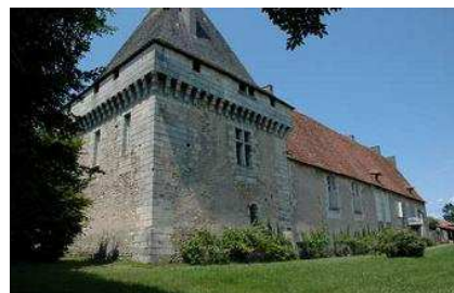
(11) Château de Richemont N 45° 24' 39.4, E 0° 36' 50.2"

Retour Chez Bernard Combiers : N 45° 30' 11.3", E 0° 24' 20.0"