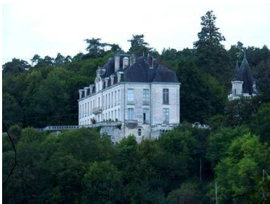
(10) Château de Vaugoubert N 45° 25' 28.23", E 0° 41' 47.48"