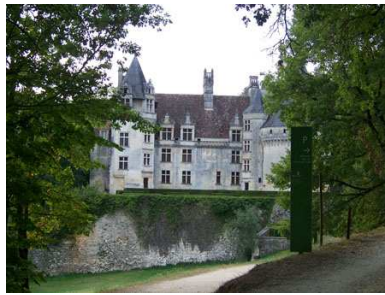
(8) Château de Puyguilhem N 45° 25' 32.5", E 0° 44' 41.3"