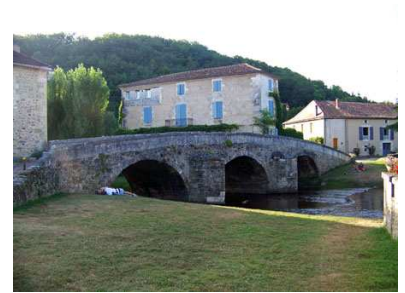
(6) St Jean de Côle : Un des plus beaux villages de France Ancienne abbaye, château et pont N 45° 25' 16.44", E 0° 50' 18.55"