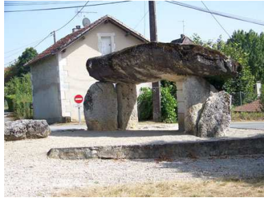
(2) Dolmen de Peyrelevade N 45° 21' 40.7", E 0° 39' 46.9"