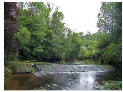
(3) Le Moulin de la Croix : N 45° 22' 04.2", E 0° 44' 03.4"