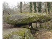
Roc de Poperdou

A Nontron on peut visiter la coutellerie